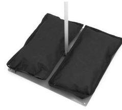
1 x 10 kg