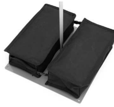
2 x 15 kg