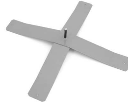
1000 X 1000 x 40 [mm] 8,4 kg