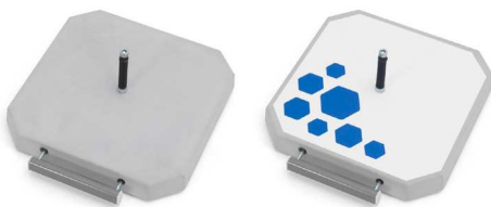
PB 370 R15 370 x 370 x 50 [mm], 15 kg