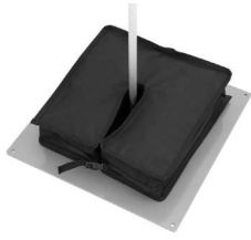
1 x 20 kg