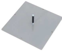
300 x 300 [mm] 2,2 kg