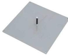
400 x 400 [mm] 5,4 kg