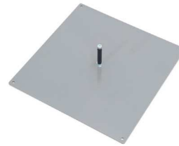
500 x 500 [mm] 10 kg