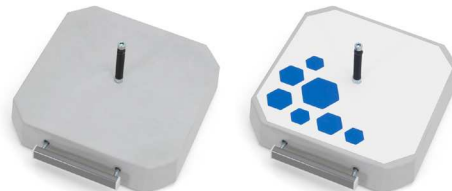
PB 370 R25 370 x 370 x 80 [mm], 25 kg