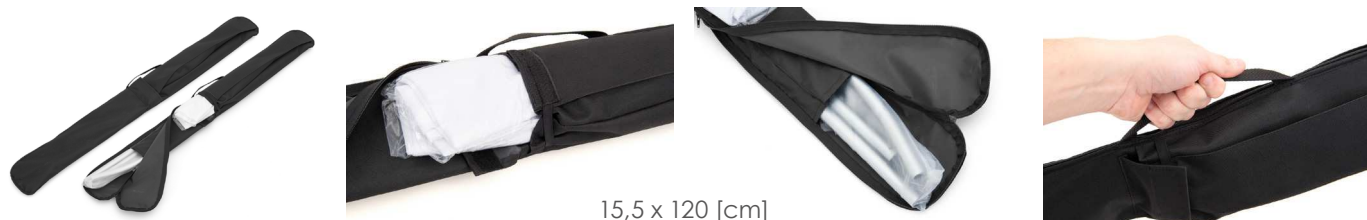
15,5 x 120 [cm]