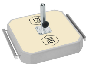
un autocollant laminé personnalisé en option